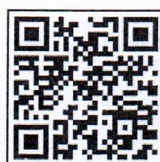
สมัครอบรม