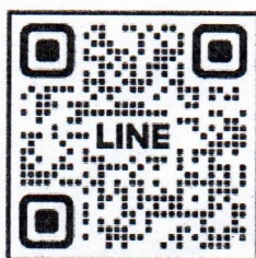
สอบถามข้อมูล