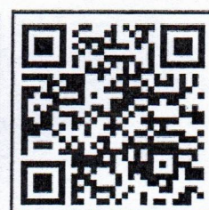
เว็บไซต์