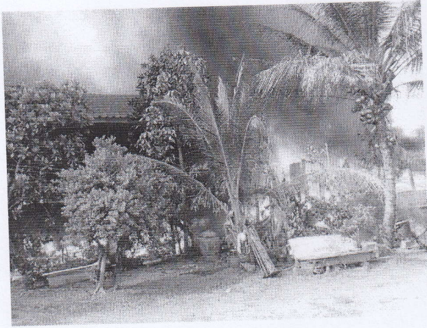
ภาพถ่ายบ้านนักเรียนประสบอัคคีภัย